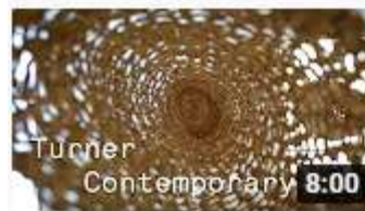
'Entangled: Threads & Making' Female Artists and... Turner Contemporary 24 tūkst. skatījumu • pirms 5 gadiem

2.-4. mācību stundas Izstrādā idejas skici. Savāc nepieciešamos materiālus.