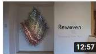
Rewoven: Innovative Fiber Art CUNYQueensborough 7,6 tūkst. skatījumu • pirms 4 gadiem

2.mācību stundas Noskatās filmas par laikmetīgo šķiedru mākslu, diskusija par tēmu.