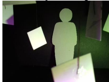
Emocija - Laimīgs

Renāte Babre 13. gadi, 6.klase Anastasija Mališeva 13. gadi, 6. klase Zana Nikonova 13. gadi, 6. klase