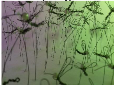
Emocija - Apjukums

Anastasija Grigorjeva 13. gadi, 6.klase Darja Petrova 13. gadi, 6. klase