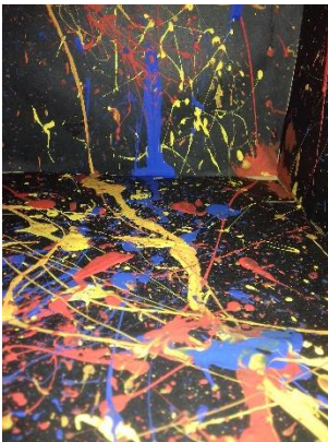
Emocija – Sajūsma